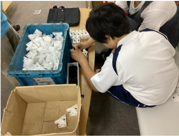
自動車の部品にゴムをつける作業

9月12日～13日、視覚障がい教育部門中学部で「進路体験」を行いました。生徒2名が地域の福祉施設で働くことを体験しました。仕事の緊張感を感じながらも、多くの人と一緒に働くことの楽しさを味わい、自分の課題について考える貴重な体験になりました。