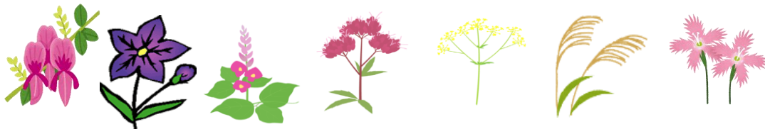
はぎ ききょう くず ふじばかま おみなえし すすき なでしこ