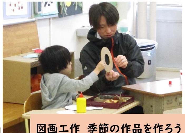
図画工作 季節の作品を作ろう