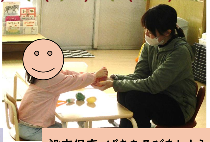
設定保育 げきあそびをしよう