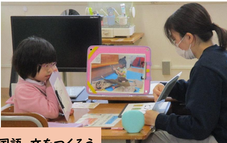
国語 文をつくろう