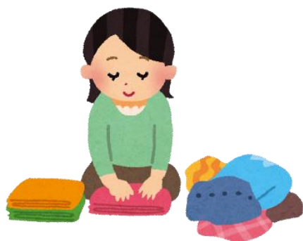
タオル、ユニフォームたたみ